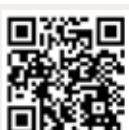
QR - Code zur Webseite unbezahlbar In den Warenkorb