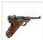
Mauser Parabellum Pistole CHF 1'450.00* In den Warenkorb