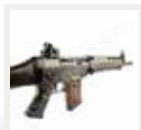
Schweizer Stgw PE90 CHF 1'550.00* In den Warenkorb

Immer Aktuell und schon bald mit ihrer Waffe bei uns im Shop