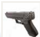
GLOCK Pistole 9mm ab CHF 850.00* In den Warenkorb