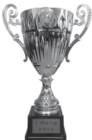
Rothenthurmer Becher 300m