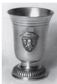
Kleiner Rothenthurmer Becher 300m