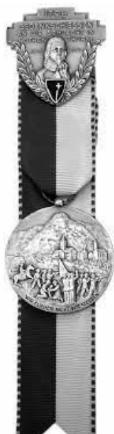
EINZELAUSZEICHNUNG: Kranz oder Kranzkarte