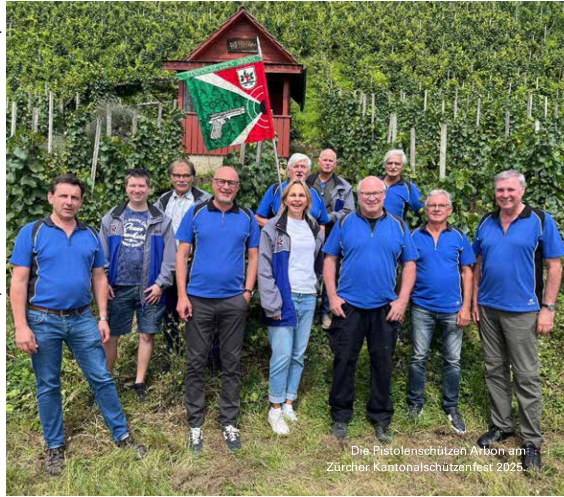
Die Pistolenschützen Arbon am Zürcher Kantonal-schützenfest 2025.

Während des Anlasses nicht bezogene Auszahlungen verfallen zu Gunsten des Organizers.