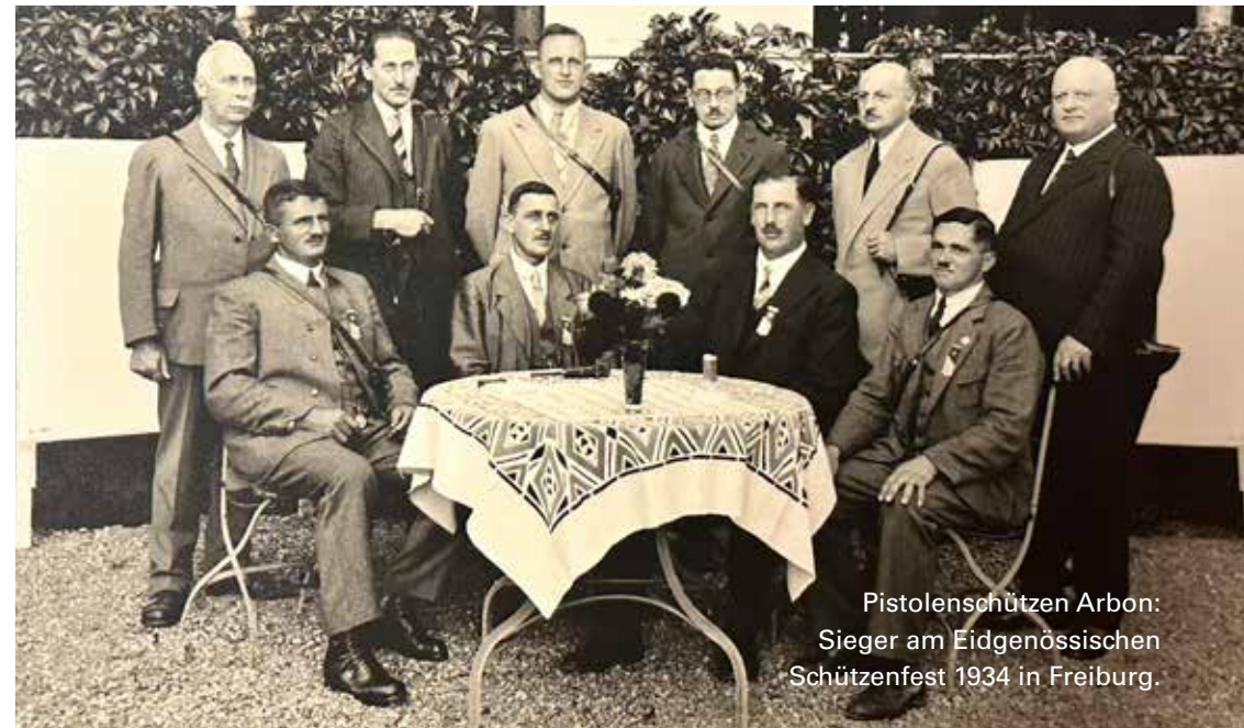
Pistolenschützen Arbon: Sieger am Eidgenössischen Schützenfest 1934 in Freiburg.