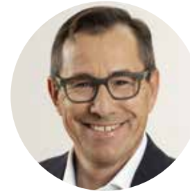
René Walther Stadtpräsident Arbon

Freitag 1. Mai 2026 13.30 bis 18.30 Uhr Samstag 2. Mai 2026 9 bis 12 Uhr 13.30 bis 17 Uhr Samstag 9. Mai 2026 9 bis 12 Uhr 13.30 bis 17 Uhr Sonntag 10. Mai 2026 9 bis 12 Uhr